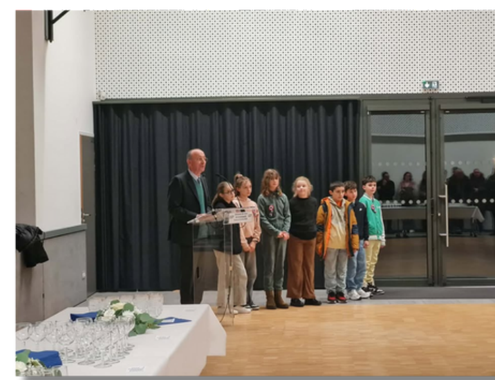
Cérémonie des vœux de la municipalité, le 9 janvier