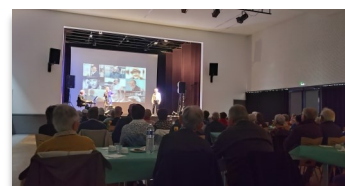
Après-midi récréatif du CCAS Le 5 avril