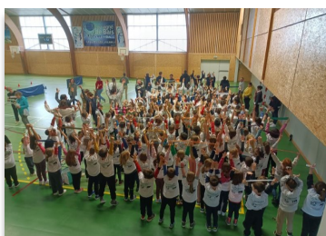
Journée olympique des 2 écoles le 2 avril