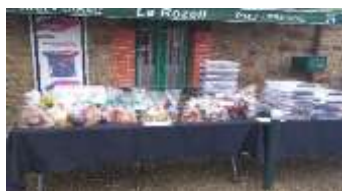
Vente de chocolats le 2 avril