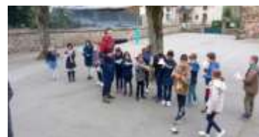
Aéromodélisme Centre de Loisirs