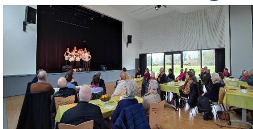
Goûter du CCAS - 11 mars