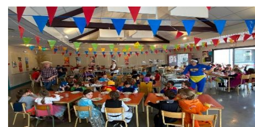
Carnaval à la cantine - 16 mars