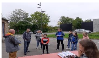
Carte au trésor