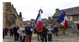
Commémoration – 8 mai